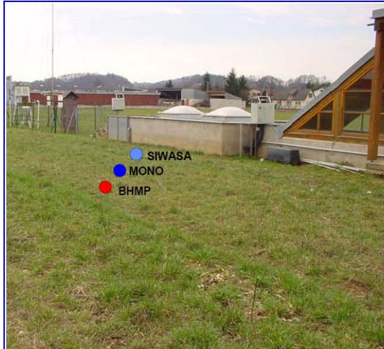
Lysimetereinbau am Versuchsfeld Wagna: